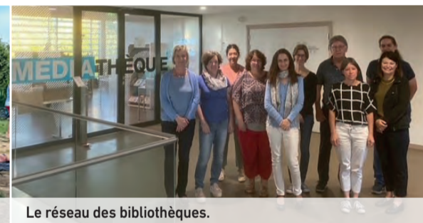
Le réseau des bibliothèques.