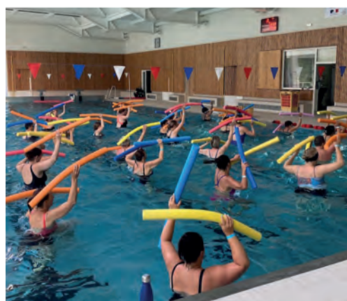
Une animation Matinal'Eau en juillet 2023.