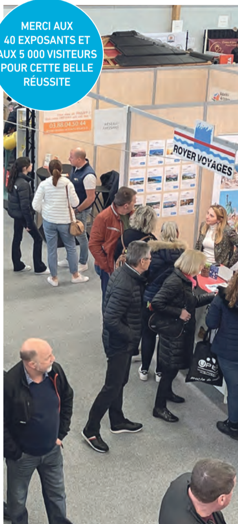
Les conseils des pros pour un public intéressé.

MERCI AUX 40 EXPOSANTS ET AUX 5 000 VISITEURS POUR CETTE BELLE RÉUSSITE