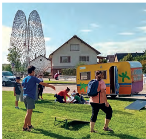
La Caravane des Jeux sur le parvis de la piscine Odonates.