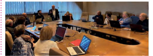
L'un des ateliers d'informatique à la mairie d'Offendorf.

Les premières animations ont démarré au printemps 2024 par des ateliers gratuits d'informatique. Dix séances ont été organisées à la médiathèque de Roeschwoog et dans les mairies de Kilstett et d'Offendorf entre mars et juin, huit sur ordinateur et deux sur smartphone. Cybergrange, intervenant spécialisé, a aidé les participants, très motivés, à se familiariser avec l'univers informatique et les réseaux sociaux et à naviguer sur internet et utiliser une boîte mail.