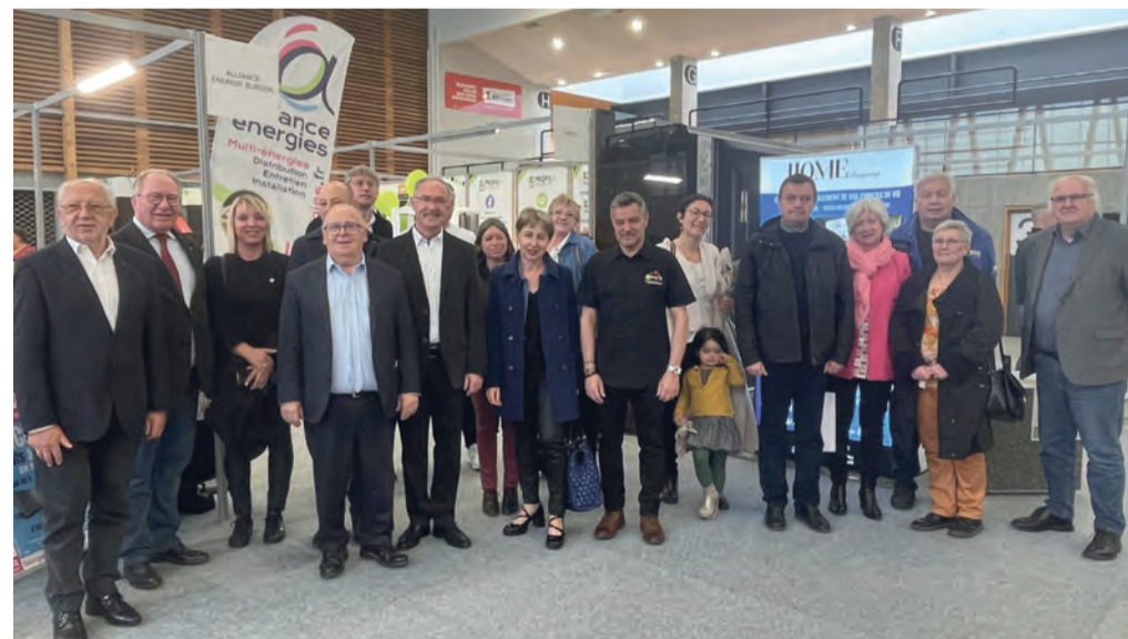
Les élus du territoire et les officiels à l'inauguration du salon.

Créée en 2010, cette association est un acteur majeur de la vie économique et joue un rôle de relais auprès des professionnels. Elle élabore notamment des animations permettant de mettre en avant l'artisanat et le commerce de proximité.