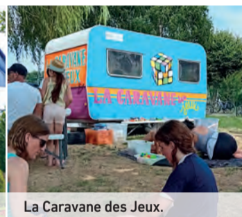
La Caravane des Jeux.