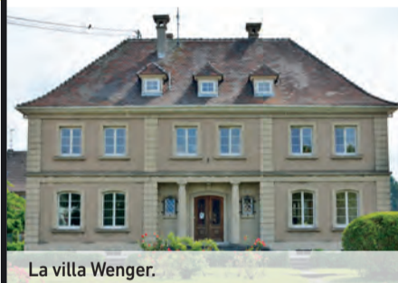
La villa Wenger.