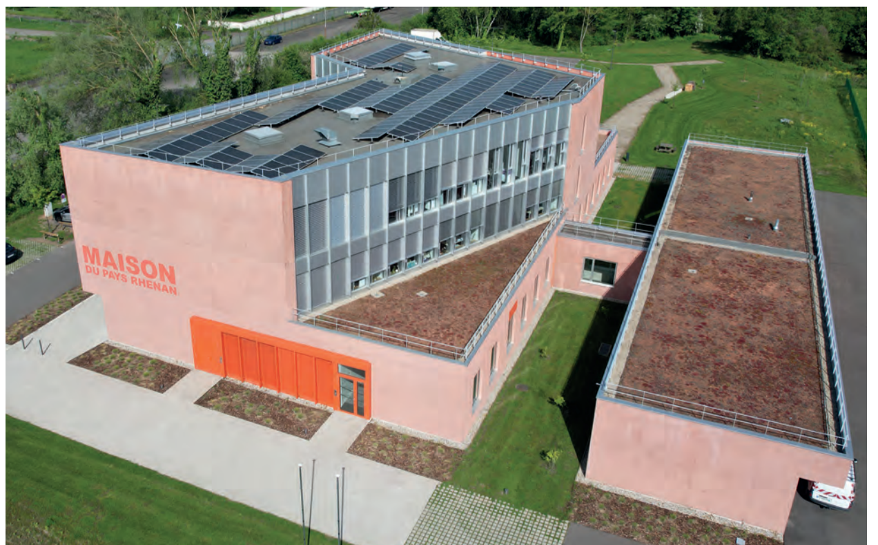
La Maison du Pays Rhénan à Drusenheim : un site central dans la Communauté de communes et un bâtiment « repère », bien visible et facile d'accès pour tous.

> Les photos de l'inauguration en page 2.